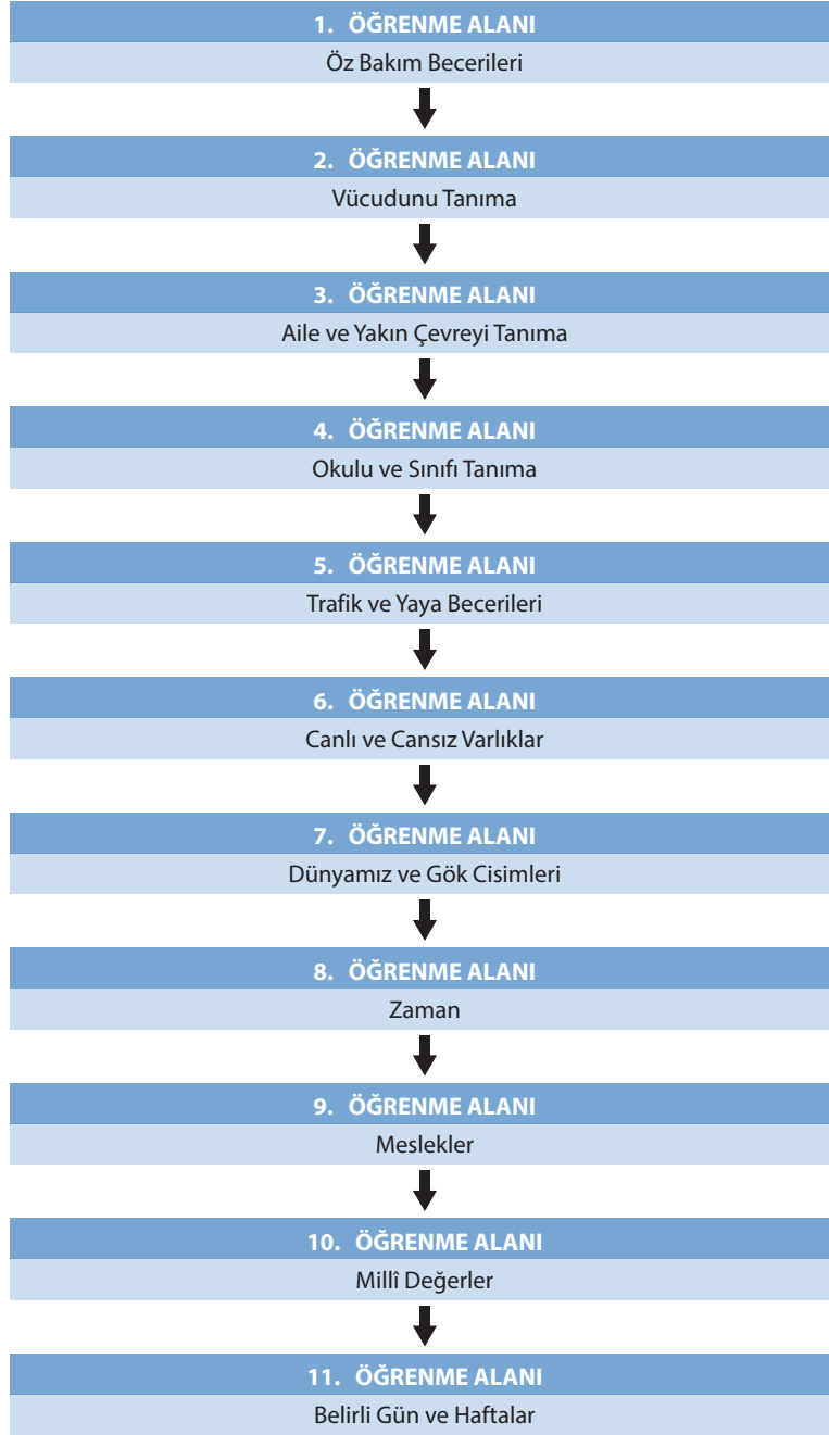
Şekil 2. I. Kademe Hayat Bilgisi Dersi Öğretim Programı Öğrenme Alanları

Öz Bakım Becerileri: Öz bakım becerileri arasında kişisel temizlik, giyinme, yemek yeme ve tuvalete ilişkin beceriler yer alır. Öz bakım becerileri alanı, doğuştan getirilmeyen, sonradan kazanılan davranışları geliştirmeyi amaçlayan bir öğrenme alanıdır. Normal gelişim gösteren öğrencilerde özbakım becerileri, çocuğun bilişsel ve psikomotor gelişim düzeylerindeki olgunluğa paralel olarak kendiliğinden gelişir. Ancak