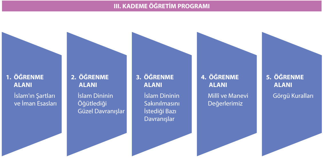
Şekil 2. III. Kademe Din Kültürü ve Ahlak Bilgisi Dersi Öğretim Programı Öğrenme Alanları

İslam'ın Şartları ve İman Esasları: Bu öğrenme alanında öğrencilerin imanın anlamıyla birlikte imanın ve İslam'ın şartlarının neler olduğunu ifade etmeleri hedeflenmektedir.